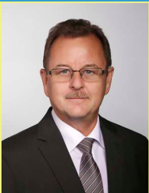
Frank Bannert Landrat des Saalekreises